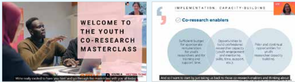
「청소년 공동연구 툴킷」 사용 설명 영상

툴킷을 개발한 웨스턴시드니대학교 Y&R센터는 청소년 공동연구를 활성화하고 누구나 쉽게 툴킷을 이해하고 연구에 활용할 수 있도록 하기 위해 다양한 워크숍을 개최하고 있다. 더 자세한 내용을 알고 싶다면 웨스턴시드니대학교 홈페이지에서 이전에 운영한 워크숍 영상을 찾아볼 수 있다.