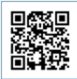
「청소년 공동연구 툴킷」 바로가기