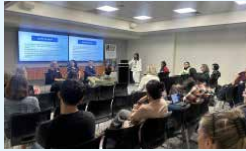
제74회 ICA 학술대회 현장